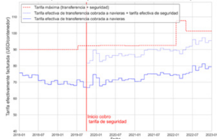
Figura N°2: Evolución de las tarifas máximas y efectivamente cobradas por TPS por los servicios básicos de transferencia de carga y efectos del cobro de la tarifa de seguridad para contenedores de 20 pies llenos (enero 2018 a diciembre de 2022)