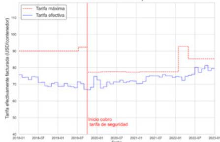
Figura N°1: Evolución de las tarifas máximas y efectivamente cobradas por TPS por los servicios básicos de transferencia a empresas navieras para contenedores de 20 pies llenos (enero 2018 a diciembre de 2022)